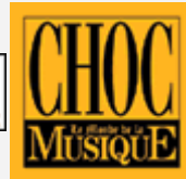
Le Monde de la Musique n°243