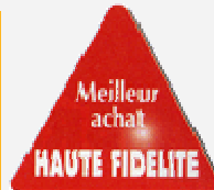
Haute Fidélité n°46