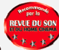
La Revue du Son n°259